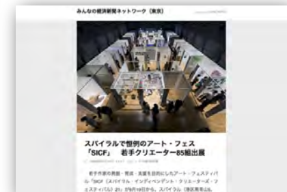
LINE NEWS (2020年9月14日、9月19日掲載)