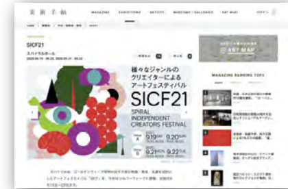
美術手帖 (2020年9月14日掲載)