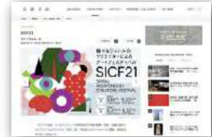
美術手帖 (2020年9月14日掲載)